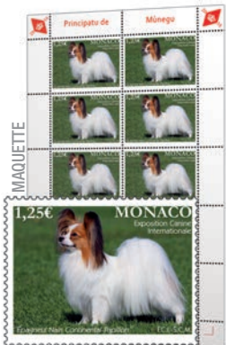
Impression : Offset Format du timbre : 40,85 x 30 mm Tirage : 50 000

> Emission le 5 février 2016 / FDC petit format